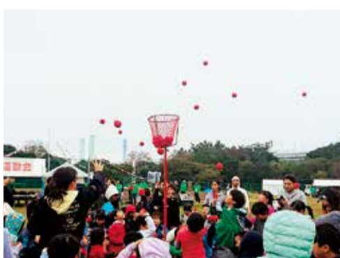
全横浜港湾大運動会

平成三十年十一月四日(日)、第二十七回横浜港大運動会が、大黒ふ頭グラウンドにて開催され、今年も大勢の港湾関係者とその家族の方が集まりました。当日は生憎の天気となり、一部プログラムが変更されましたが、子供たちの競争や人気とうなぎ掴み競争等、大いに盛り上がり、白熱した運動会となりました。