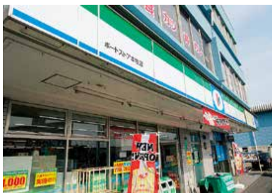
ポストアール本牧店

〈営業時間〉24時間営業 045(628)2381 両店とも公共料金等各種支払可・電子マネー決済対応