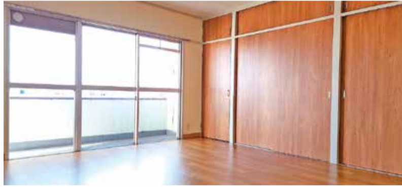
広々とした洋室 (昨年度の完成写真)

また、確認のため当協会からご連絡する場合がありますので、メールにご連絡先の記載をお願いいたします。 保養所受付専用メールアドレス hoyoujyo@y-port-kousei.or.jp