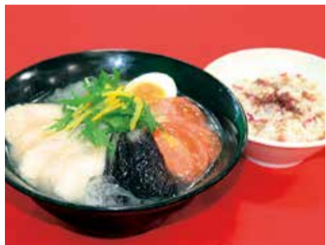
塩冷やしラーメン・梅シラスご飯セット

七月の「塩冷やしラーメン・梅シラスご飯」は、お勧めの新メニューです。赤いトマト、緑の野菜、黄色い柚子、紫の茄子と彩りも良く、さっぱりとした