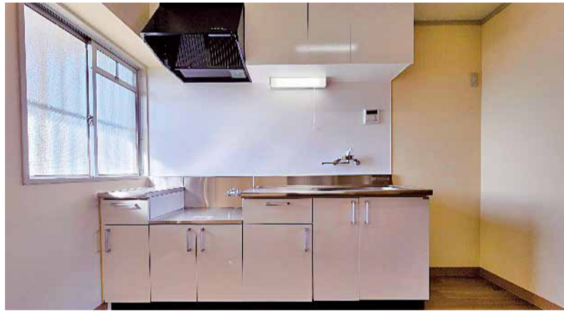
キッチン (昨年度の完成写真)